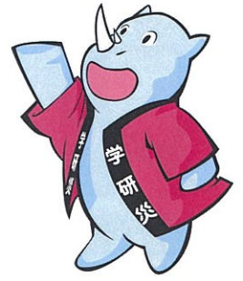
学研災キャラクター サイちゃん